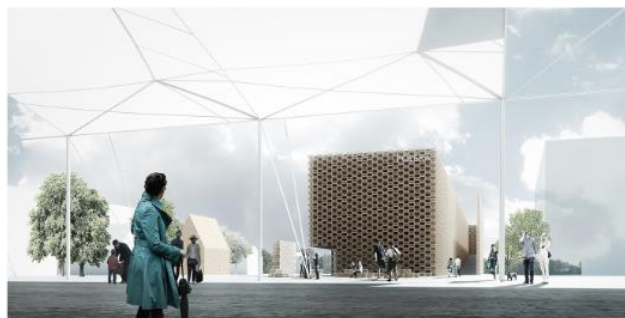
Widok elewacji frontowej od Decumanus