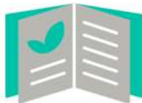
artykuły poświęcone ekologii