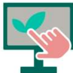
EkoBiuro w intranecie NBP