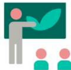
warsztaty dla dzieci